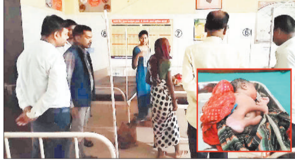
प्रसूता से जानकारी लेते चिकित्सक, इनसेट में नवजात।

घंटों तक दर्द से तड़पने के बाद महिला का जमीन पर ही असुरक्षित तरीके से प्रसव हो गया। महिला के प्रसव उपरान्त चिकित्सक अस्पताल पहुंचे। अब इस मामले में सीएमएचओ ने जांच के लिए टीम