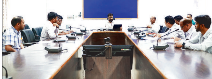
अधिकारियों की बैठक लेते कलेक्टर।

कलेक्टर ने सभी अधिकारियों का निर्देश दिए की यह सुनिश्चित किया जाना चाहिए की