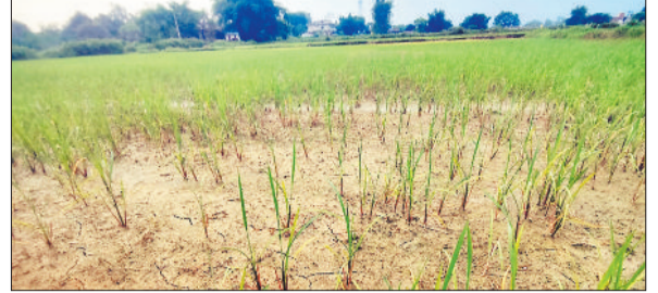
बारिश के अभाव में सूख रहे खेत।