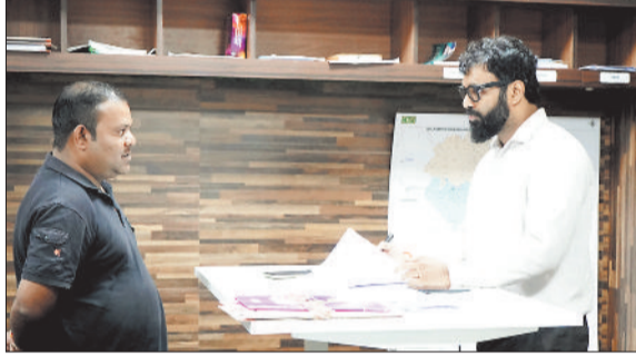
लोगों की समस्या सुनते कलेक्टर।