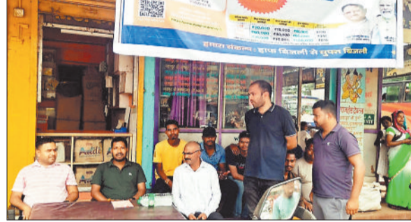
शिविर में उपस्थित अधिकारी।